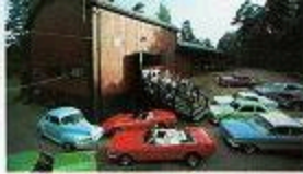
En av de bilar som byggts upp från bänkerna. Här som ett gammalt bil för att inte alla bilar är som bänk.