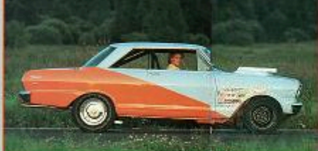
Medan alla ville. Många säger sig en roll. Bara det gör det!