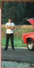
En dragning med 302-motor. Den har varit en dragning i Örebro.