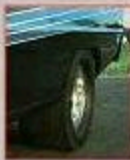
ning om. Men i originalitet för det 2000.