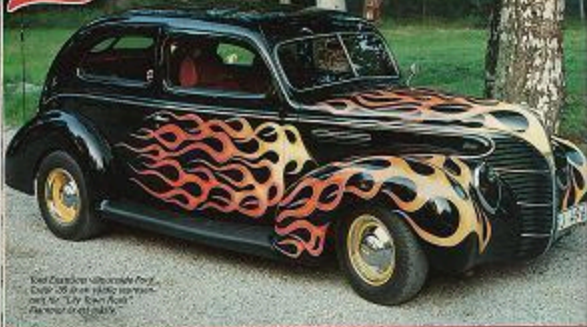
Vad betyder världsutställning Ford Coupé '35 är ett viktigt moment för Mr. "Lily Town" Rods. Förstärkt av en bild.