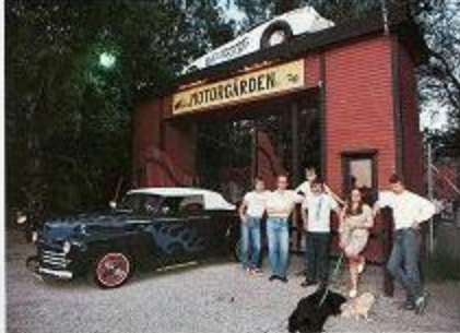
Det är en av de bilar som byggts upp från bänkerna. Här som ett gammalt bil för att inte alla bilar är som bänk.

— Det låter inte som om det är en traditionell praxis! — Det låter inte som om det är en traditionell praxis! — Det låter inte som om det är en traditionell praxis!