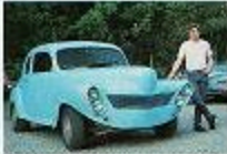
Det är en av de bilar som byggts upp från bänkerna. Här som ett gammalt bil för att inte alla bilar är som bänk.

— Det låter inte som om det är en traditionell praxis! — Det låter inte som om det är en traditionell praxis! — Det låter inte som om det är en traditionell praxis!